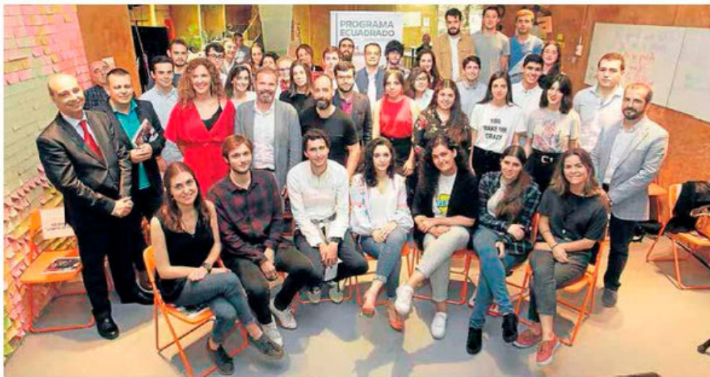
Los universitarios, con los organizadores y patrocinadores en el Talud de La Ería.