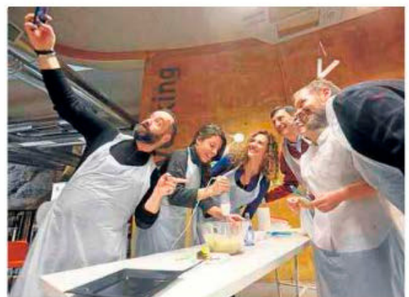
Los participantes durante el taller de cocina.